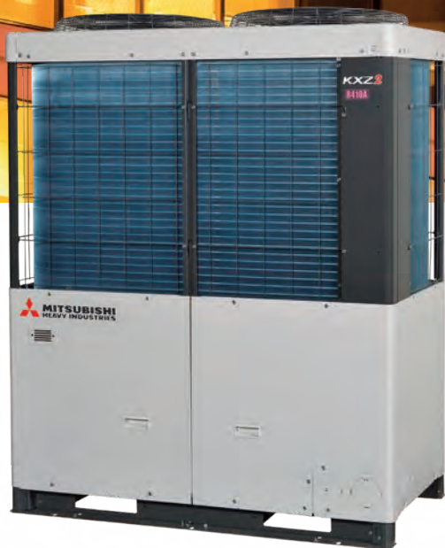
10HP (28,0 kW)

Maggiore efficienza energetica con i sistemi KXZX2 in pompa di calore, in qualsiasi combinazione di unità esterne.