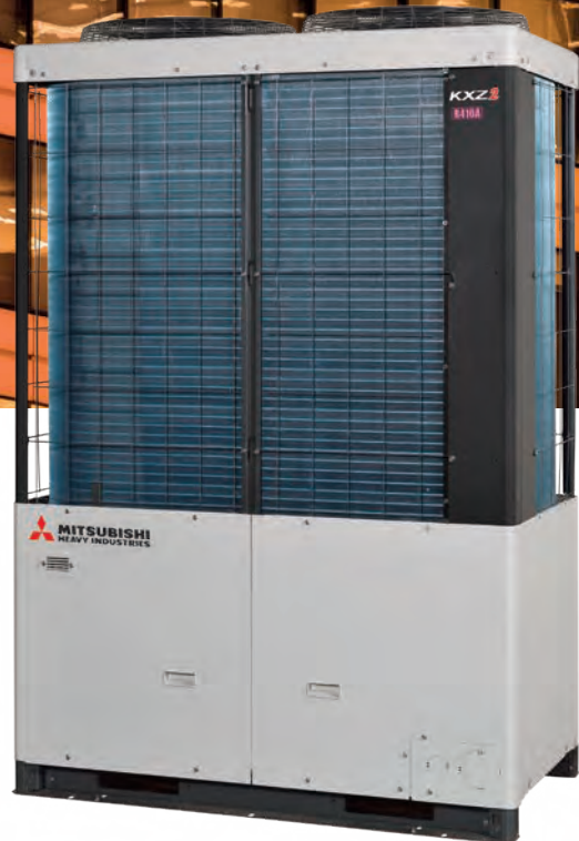
12~14HP (33,5~40,0 kW)