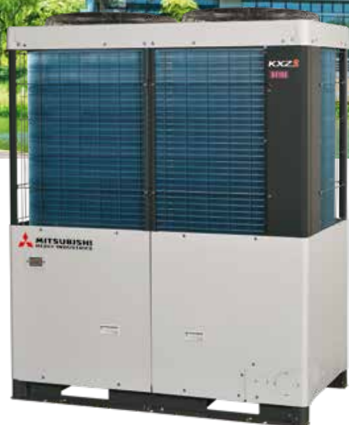
10HP (28,0 kW)

Maggiore efficienza energetica con i sistemi KXZX2 in pompa di calore, in qualsiasi combinazione di unità esterne.