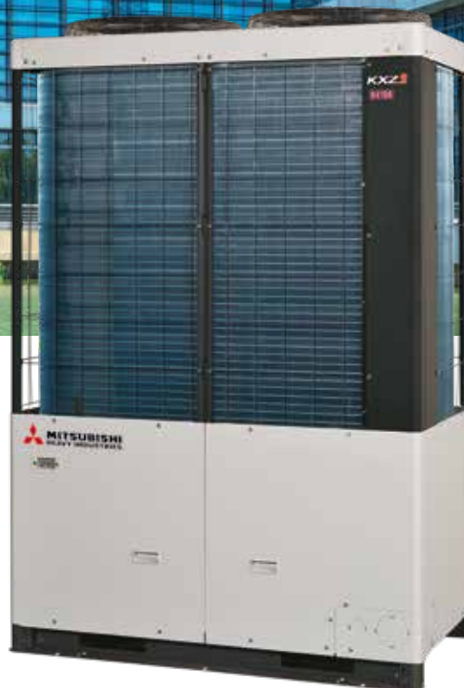
12~14HP (33,5~40,0 kW)